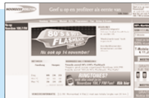
Noordzee FM bood 80,4 miljoen euro