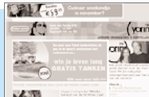
Yorin bood 32,892 miljoen euro

In de tweede ronde werd voor elk overgebleven kavel opnieuw de rangorde tussen de (nog in de procedure zijnde) spelers vastgesteld. De spelers die in deze ronde op een kavel als