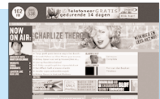
Radio 538 bood 57,0 miljoen euro