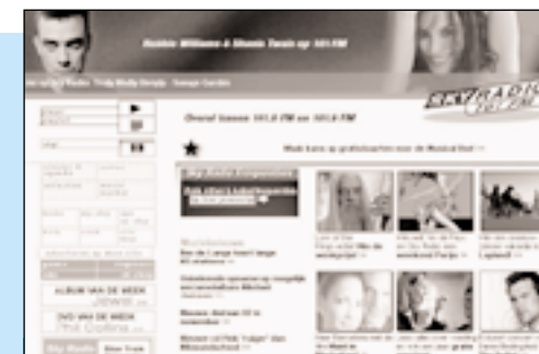
Sky Radio bood 56,025 miljoen euro